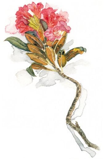
Rhododendron ferrugineum , Nathalie Magrou