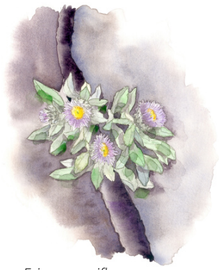
Erigeron uniflorus , Nathalie Magrou