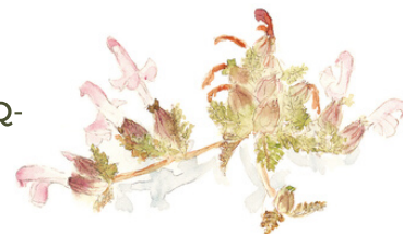
Pedicularis sylvatica , Nathalie Magrou

Inscription ici : https://docs.google.com/forms/d/e/1FAIpQLSfR73jbFLWfQX8IJYvfQ-dTFw5MvD5CMuheJlvpMbjkr3Z73g/viewform?vc=0&c=0&w=1